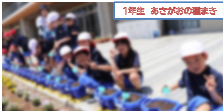
1年生 あさがおの種まき

1年生はあさがおの種を、2年生は野菜の苗を植えました。1年生は一人一人専用の鉢にあさがおの種をまきました。校舎南側の広いスペースを使い観察を行います。秋にはリース作りも計画されています。