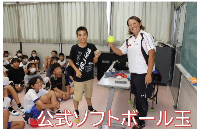
公式ソフトボール玉