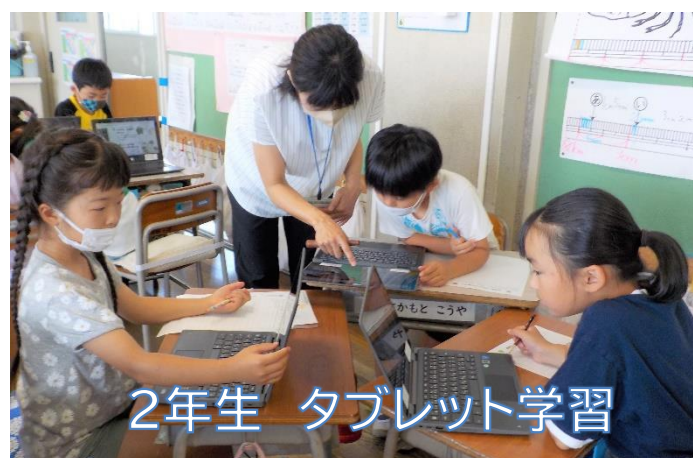
2年生 タブレット学習

子供たちの頑張る姿を、写真でお届けしました。教室の中だけではなく、校庭に出たり、また地域の探検に出たりと、子供たちは様々な環境の中で多くの体験を通して学びを深めていきます。教育委員会や様々な関係機関の方々が学校を訪れていただきます。「先生たちと子供たちのとても良い関係が見られます。」「子どもたちが落ち着いていて、良い雰囲気の中で学習している様子が見られます。」という言葉をいただいています。