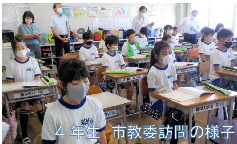
4年生 市教委訪問の様子