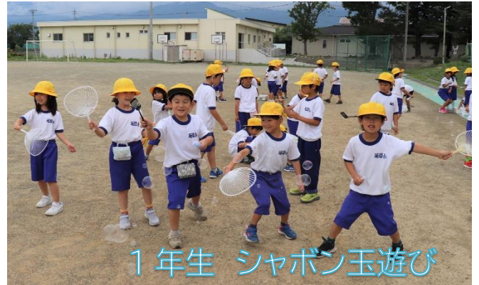
1年生 シャボン玉遊び